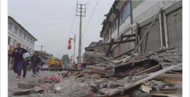
四川地震、死者180人超